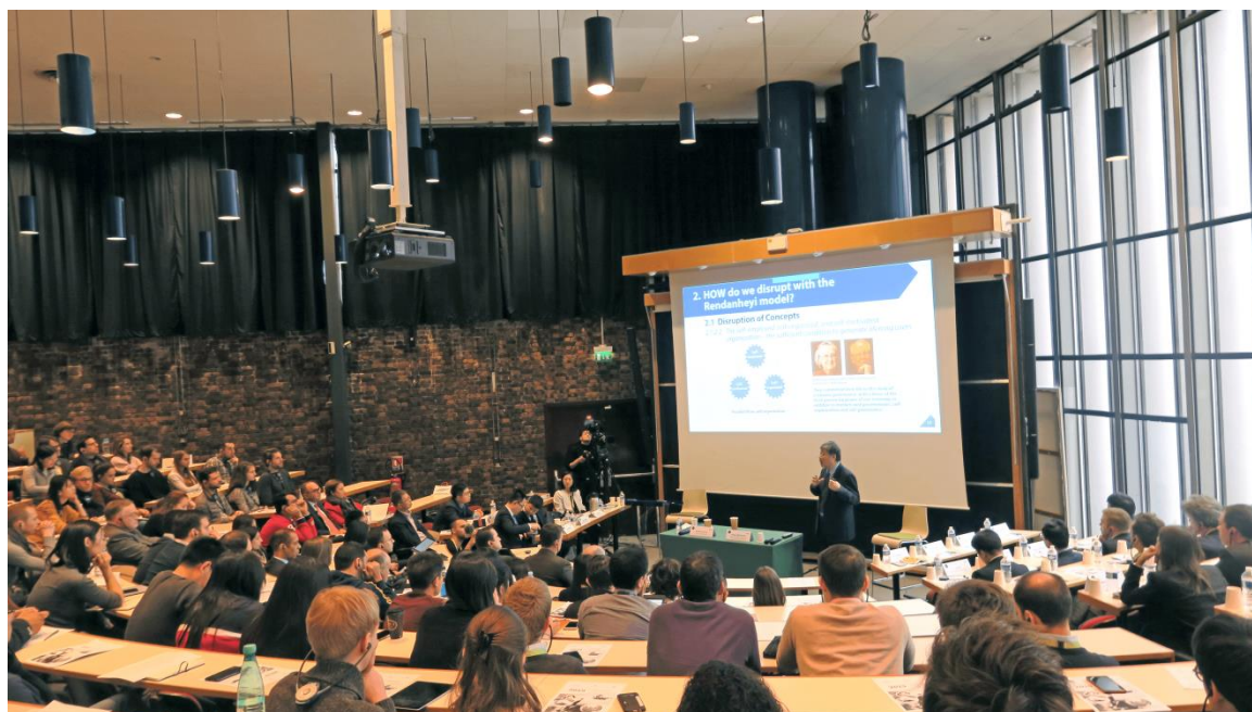
海尔集团董事局主席兼首席执行官张瑞敏在法国枫丹白露欧洲工商管理学院欧洲校区发表演讲

他总结道：“传统企业就像一座被漂亮围墙环绕着的花园，但组织的边界是不断扩大的，就像热带雨林。”员工必须与时俱进，不断更新自己的能力，为用户(客户)创造价值。同时，他们应该将用户视为共同创造者，并通过用户反馈来推动他们的目标。其先决条件是，员工必须拥有充分发挥其潜能的空间和机会。